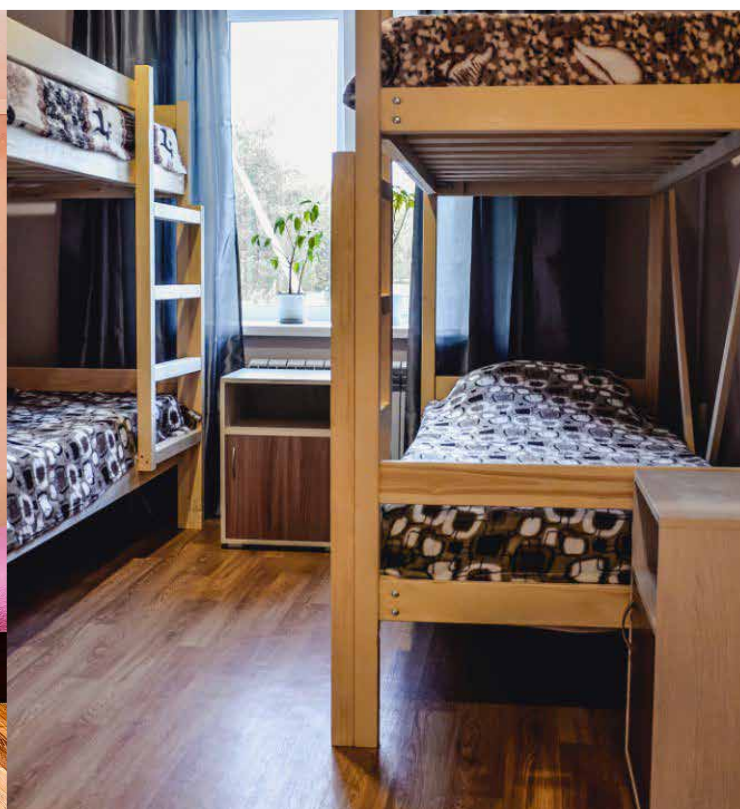
комната на 3-4 человека