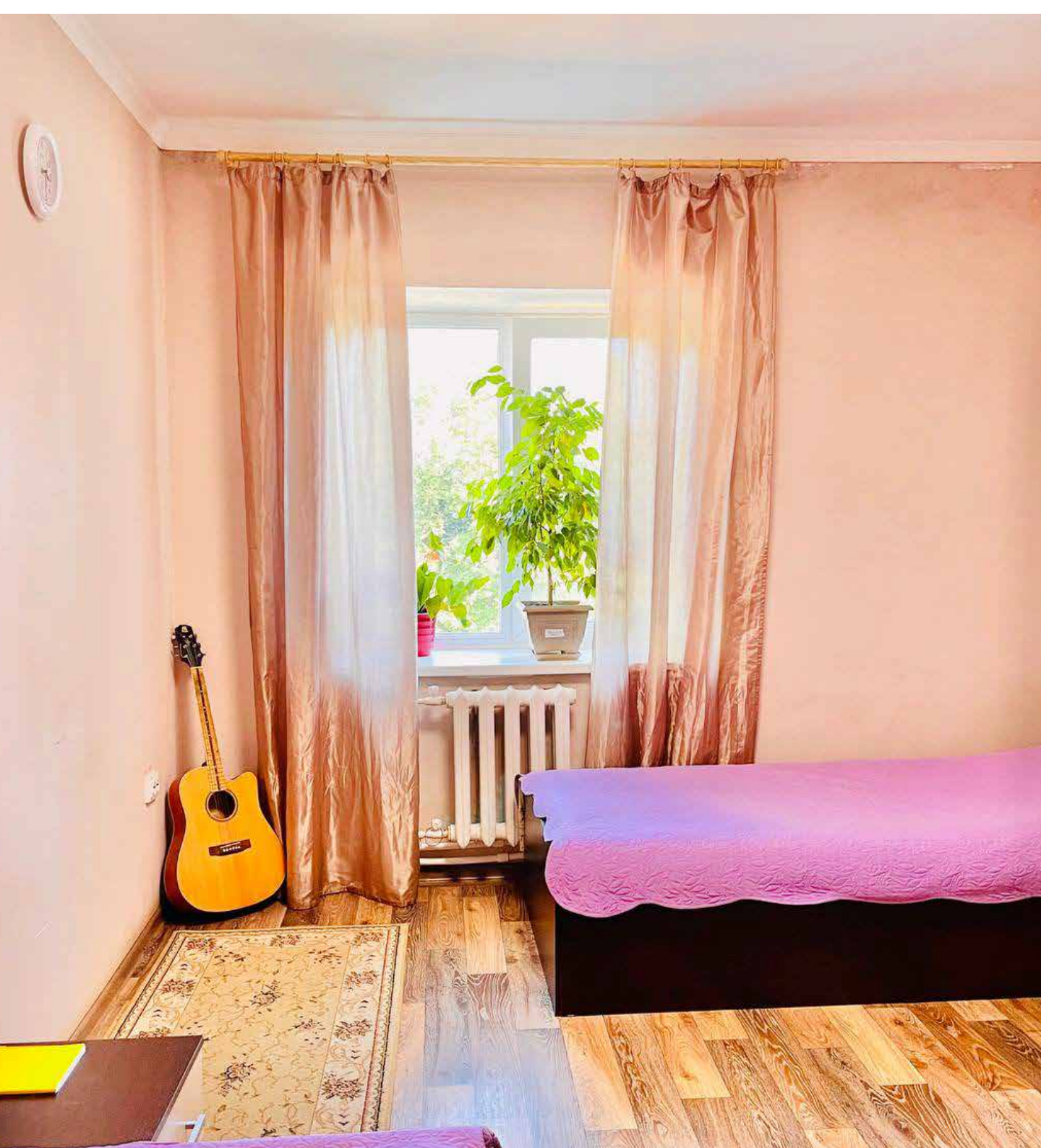
VIP комната на 1-2 человека